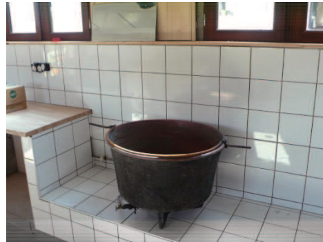
Atelier de 55 m 2 à Fayssac (81150), en cours d'achèvement. Mis gracieusement à disposition de l'association